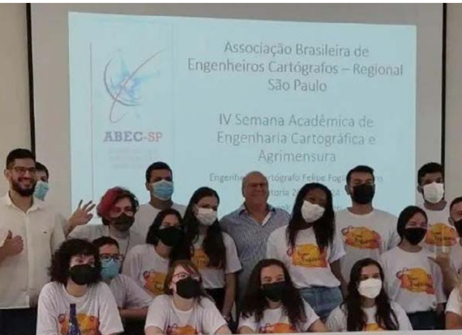
A AbecSP na junto com a Comissão Organizadora do IV SAEC - maio de 2022

estudantes e profissionais na Associação, além de assuntos relacionados à formação profissional e ao mercado de trabalho e perspectivas da atuação do engenheiro cartógrafo, por exemplo, no abrangente conceito das cidades inteligentes.