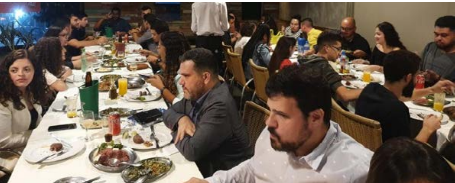
Diretores e profissionais associados da AbecSP em confraternização com os estudantes do curso de Engenharia Cartográfica e Agrimensura da Unesp-PP

O V Erecart foi encerrado festivamente com a confraternização no Kitut's Grill onde as gerações de cartógrafos se encontraram e descontraidamente se conheceram e quiçá inspiraram os futuros profissionais.